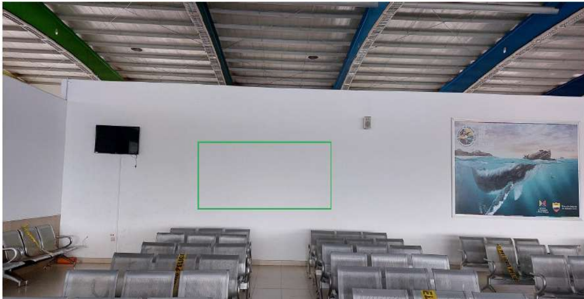
01 espacio para publicidad sala de preembarque pared limite con locales comerciales hall principal