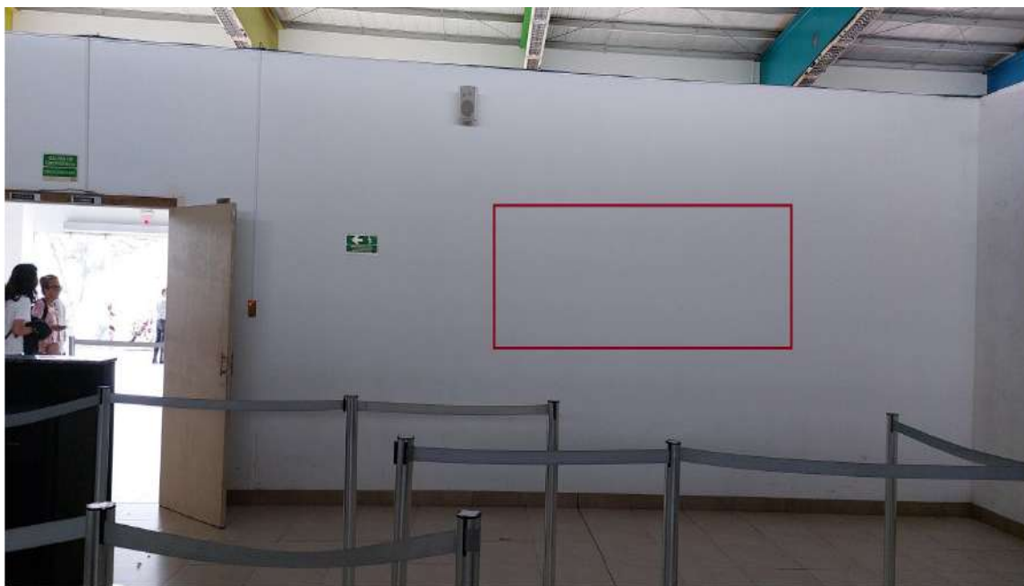
Espacio para publicidad sala de filtros de seguridad pared limite con área publica Hall Principal.